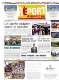
Vea la edición on-line del Réport Américas